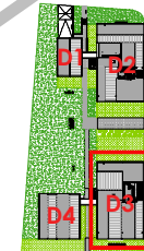
Localisation Bat D3