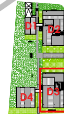
Localisation Bat D3