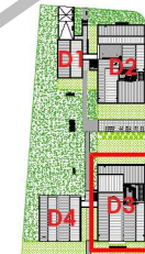
Localisation Bat D3