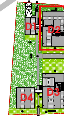
Localisation Bat D2