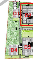
Localisation Bat D2