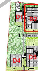
Localisation Bat D2