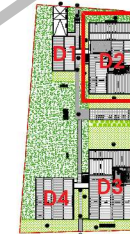
Localisation Bat D2