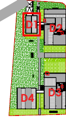
Localisation Bat D1