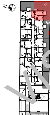
PLAN DE LOCALISATION echelle: 1/1500ème

FINITIONS SOL : PVC MUR : peinture PLAF : faux-plafond peint (Sde/Cuisine : peinture)